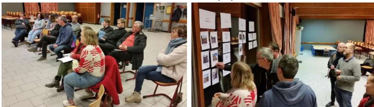
Photos de la réunion du 23/01/2023

Les votes ont lieu un lot à la fois et sont suivis d'une discussion avec les membres pour valider l'ordre établi.