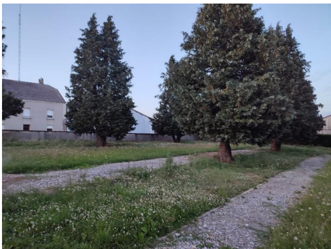
Visite du cimetière de Aix-sur-Cloie