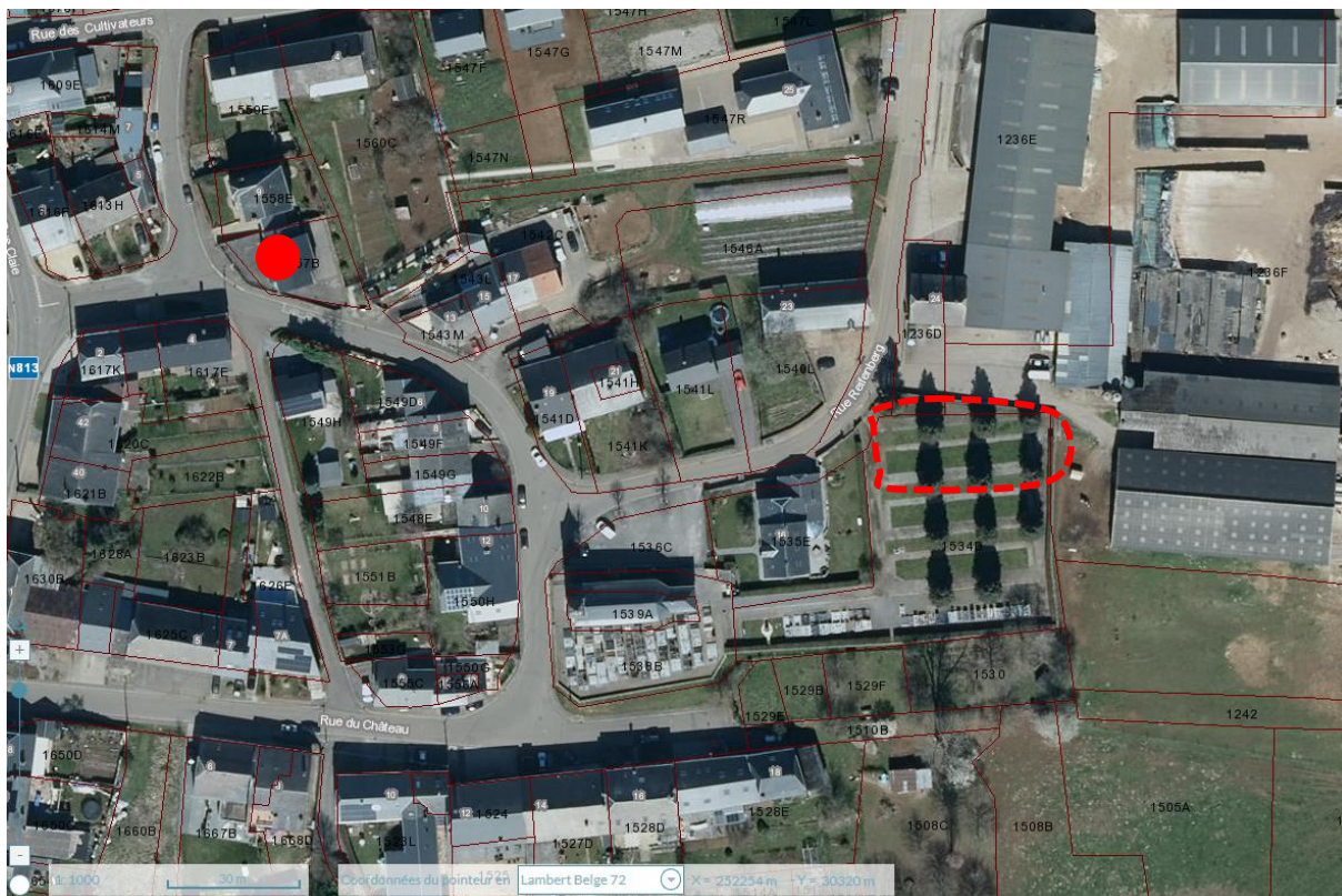
Localisation de la maison de village actuelle (point rouge) et localisation possible (en pointillés)